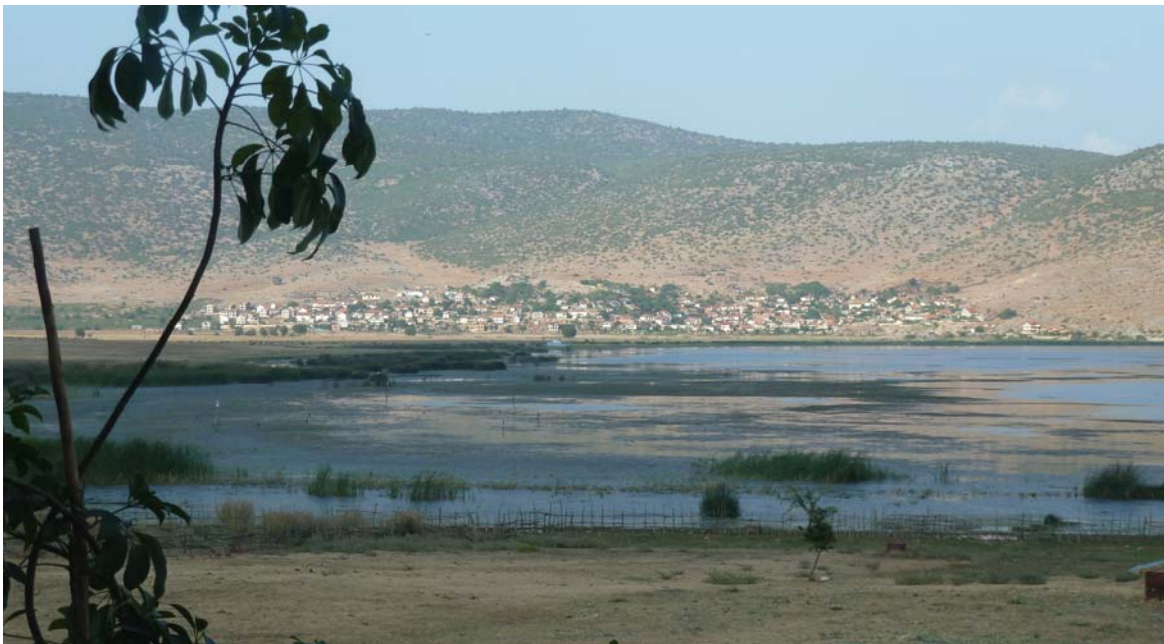
Landschaft und Vegetation am albanischen Ufer des grossen Prespa-Sees