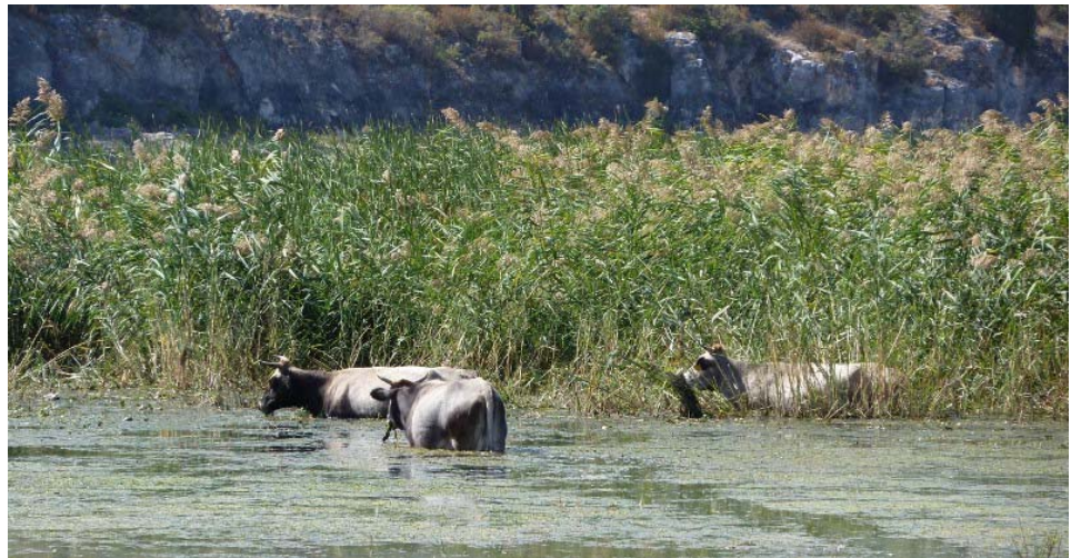
Halbwilde Prespa-Rinder in Psarades im „Naturschutz-Einsatz“ bei der Schilf-Pflege im Ried

Wie in Albanien, waren auch im griechischen Teil beim Tierankauf Tierzucht-Fachleute des Staates dabei. Dies soll nicht zuletzt auch sicherstellen, dass die Zuchten dereinst staatliche Anerkennung finden und auch Förderung erhalten werden, wenn das wirtschaftliche Klima wieder besser wird. Derzeit ist aus rechtlichen und veterinärmässigen Gründen nicht an einen Tieraustausch über die Grenzen hinweg zu denken. Aber die Zuchtstrategien bauen darauf, dass gelegentlich Zuchtmaterial zur genetischen Auffrischung verstellt werden kann.